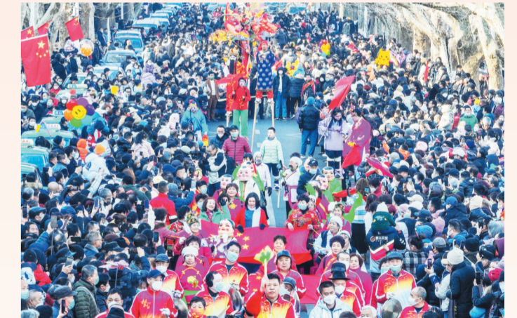
2月5日,博山区孝妇河两旁的沿河路上锣鼓喧天,人头攒动,锣鼓、舞狮、高跷、大头娃娃、旱船等传统扮玩表演让博山变成了欢乐的海洋。