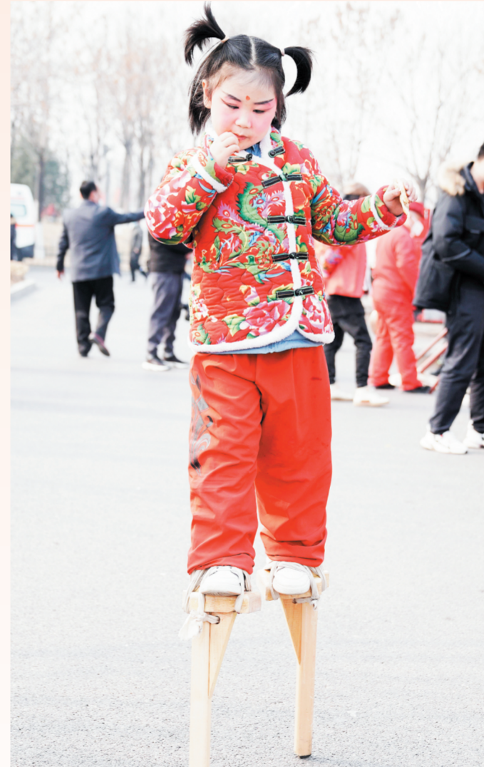
2月6日,张店孝妇河湿地公园喷泉广场,一名来自淄川区西河镇海庙村扮玩队的5岁小演员参加演出。