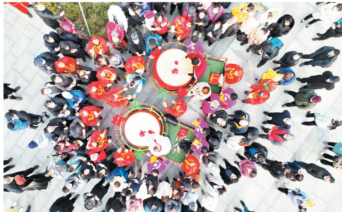
2月6日,张店孝妇河湿地公园喷泉广场,演出结束后演员们退场时观众“不依不饶”,让再打一段锣鼓。