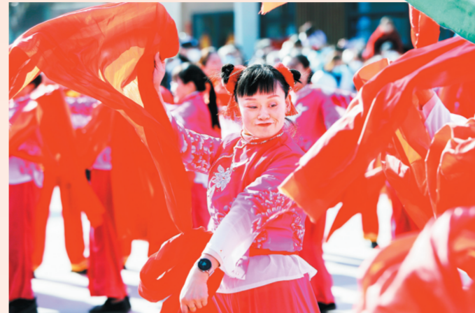
2月5日,淄博华侨城欢乐山川楼下湾文创街广场,欢快的舞蹈让表演者陶醉其中。