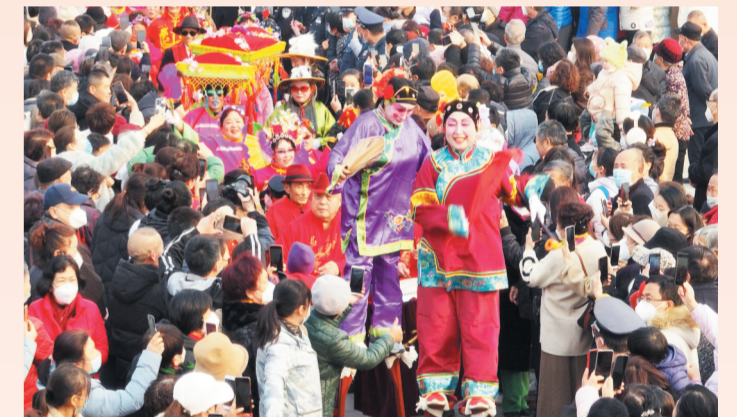
2月6日,张店孝妇河湿地公园喷泉广场,演出结束后演员们退场时,观众们夹道欢送。