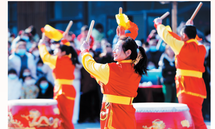
2月5日,华侨城淄博欢乐山川楼下湾文创街广场,节奏欢快的鼓声瞬间将现场气氛推向高潮。