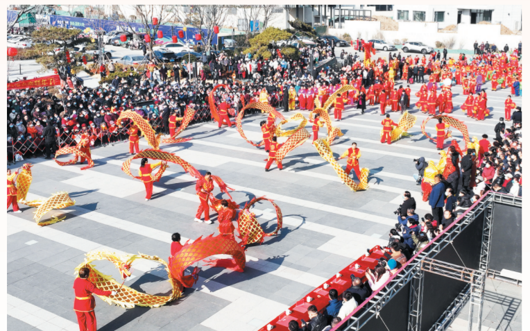
2月5日,淄博华侨城欢乐山川楼下湾文创街广场,精彩的舞龙表演让观众直呼过瘾。