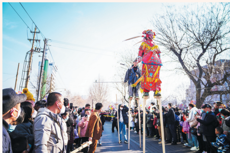
2月5日,博山区孝妇河两旁的沿河路上,高跷、旱船等传统扮玩表演吸引了大量市民观看。