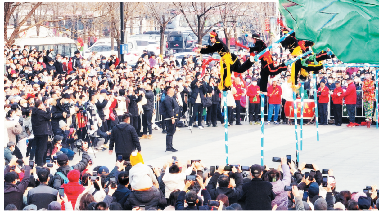
济南西关高跷队动作花样繁多,有碰拐、背拐、跌叉、翻跟头、蹲走、鹤子翻身、单腿跳空翻等多种高难度表演形式,技巧性强,难度大,引来现场观众阵阵惊呼。