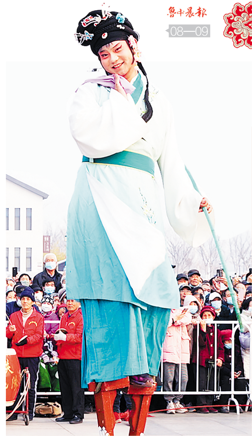
来自济南西关高跷队的“酸妮儿”表演入神,把人物的娇、媚、羞演绎得生动活泼,令人捧腹。