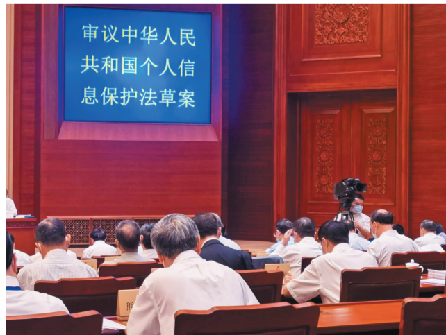
2021年8月17日,个人信息保护法草案提请十三届全国人大常委会第三十次会议三审。

要加强隐私保护意识,当浏览网页时,若提示需使用当前位置,这时需要特别注意,若没有合理的理由建议拒绝授予位置权限;平时要养成良好的习惯,在需要用到定位功能的时候再打开手机定位开关,用完要及时关闭。本报综合