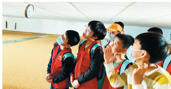
小记者们在研究温湿度表。