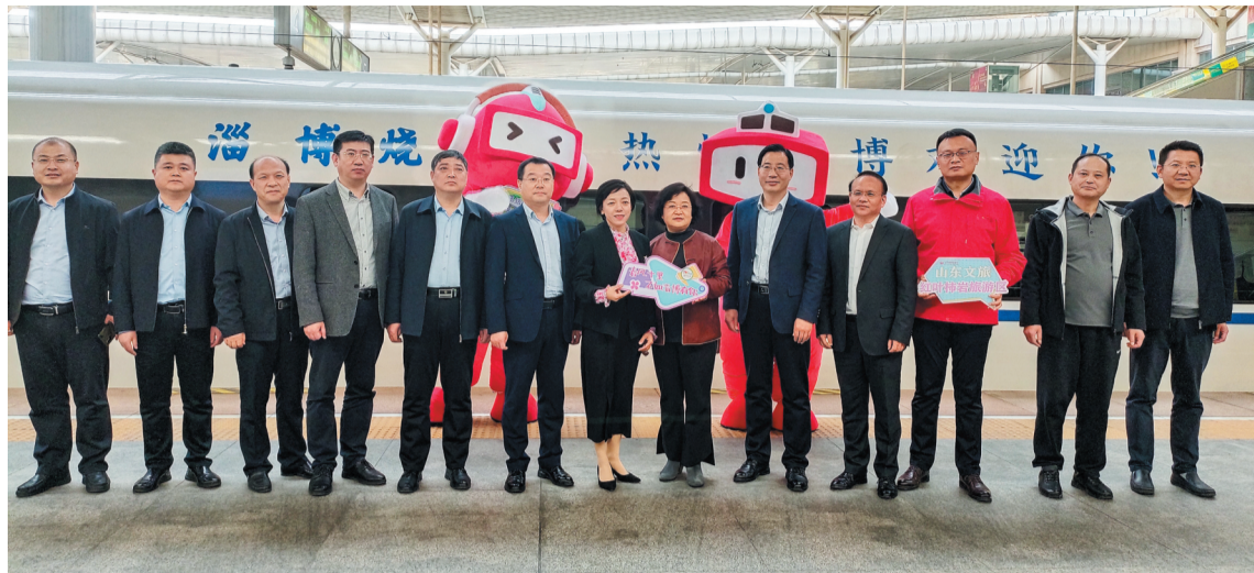
淄博市文化和旅游局党组书记、局长宋爱香带领各区县文化和旅游局局长组团出战。

10日,多云,西南风5~6级阵风7~8级减弱至4~5级阵风6~7级,13~28℃ 11日,阴局部有小雨转多云,西南风转北风4~5级阵风6~7级,11~22℃ 12日,晴间多云,南风3~4级,5~23℃