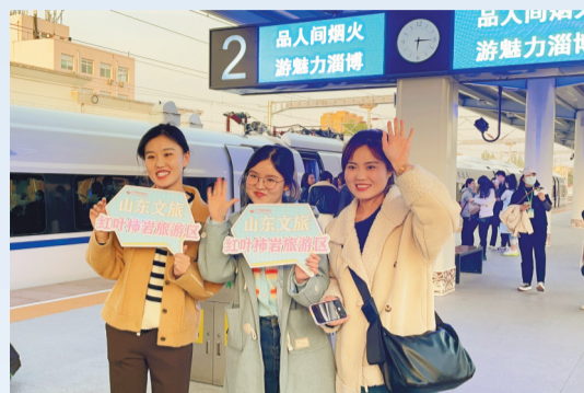
乘坐烧烤专列来淄博的大学生