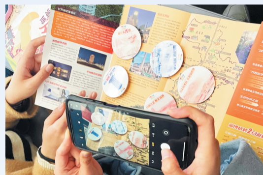
淄博城市文创徽章