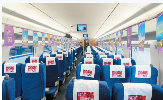
烧烤专列的车厢充满浓郁的文旅淄博特色。