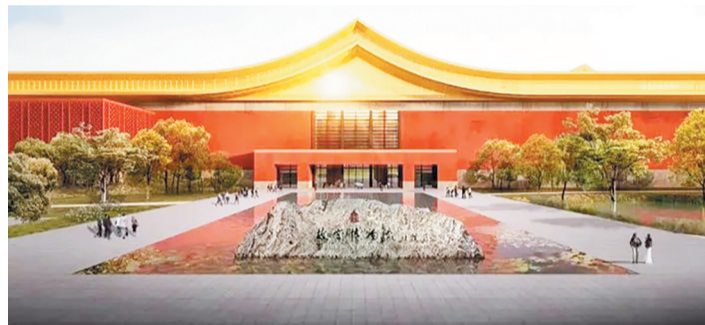
故宫博物院北院区效果图