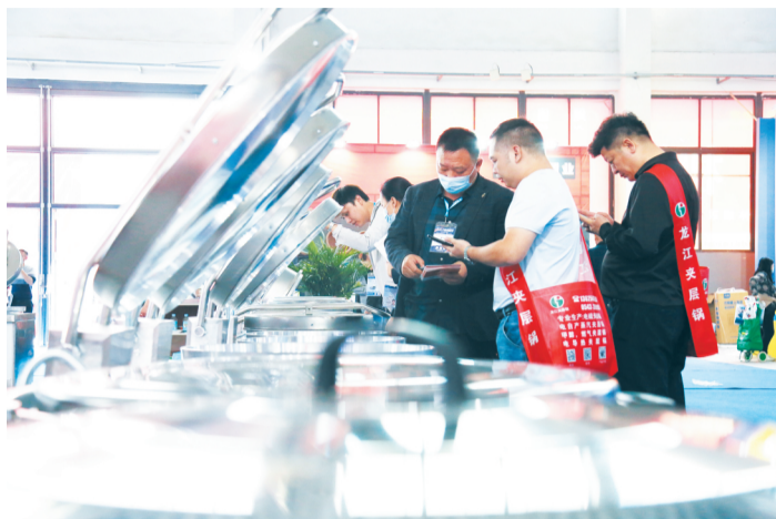
厨具节上客商忙着谈生意。

滨州市委副书记、市长李春田在开幕式上致辞。李春田表示,经过40多年的发展,厨具产业实现了从小到大、从大到强的华丽蝶变。博兴县厨具产业集群形成了生产、研发、服务的完整产业链,成为全国最大的不锈钢商用厨具生产基地。博兴拥有省级以上研发、检验等创新平台10余个,实现从国内行业领先向国际行业先锋的跨越。培育省级以上