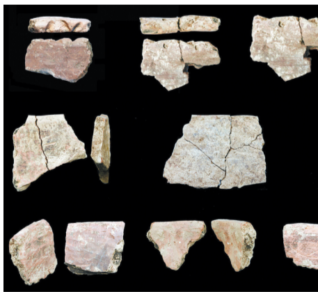
临淄赵家徐姚遗址出土陶器口沿