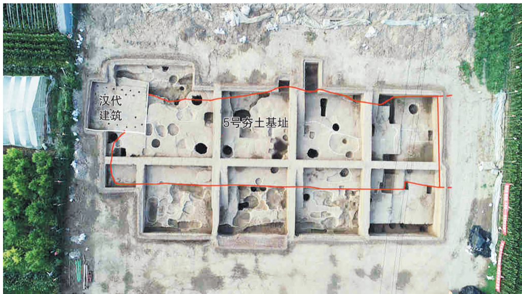
稷下学宫遗址局部