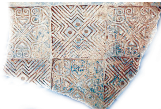
稷下学宫遗址出土的蝌蚪文和饕餮纹铺地砖