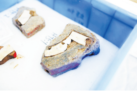
稷下学宫遗址出土的文物

5月21日上午,淄博市工业学校文物保护技术专业暨产教融合实训基地签约仪式举行。淄博市工业学校、莱芜职业技术学院、临淄区文物局共同签署了联合办学协议;淄博市工业学校、山东省水下考古研究中心、山东省文物保护修复中心共同签署文物保护技术专业产教融合实训基地