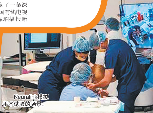
Neuralink模拟 手术试验的场景。