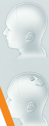
脑机设备植入流程