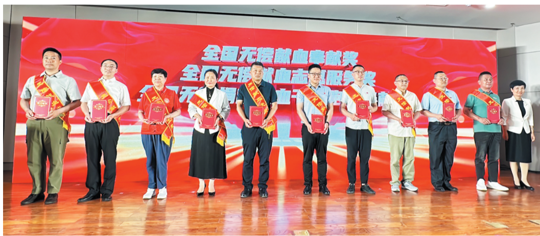
市政府副市长、市红十字会会长毕红卫(右一)为“全国无偿献血奉献奖”“全国无偿献血志愿服务奖”“全国无偿献血造血干细胞奖奉献奖”获奖代表颁奖。

献血工作表现突出个人”、2021—2022年度“全市无偿献血工作表现突出单位”、2021—2022年度“全省无偿献血工作表现突出个人”、2021—2022年度“全省无偿献血志愿服务表现突出集体”、2021—2022“全省无偿献血组织表现突出单位”、