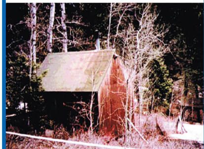
1996年4月3日，联邦调查局锁定了犯罪嫌疑人的位置，蒙大拿州的一间树林小屋。