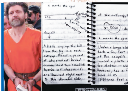
特德·卡钦斯基及其手稿