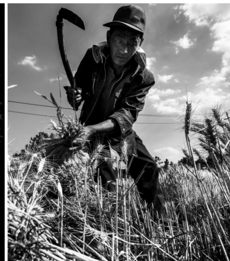
2016年6月4日 峨庄十亩地村