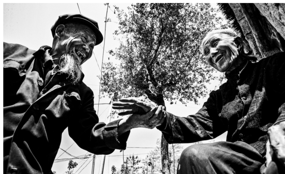
2007年5月4日 峨庄纱帽村

淄博6月27日讯 一张照片,可以看到一个人经历的沧桑,一张照片可以记录沧海桑田的变迁,一张照片可以直击心灵给人启迪和力量……6月27日上午,在“守望峨庄四十年”——钱捍乡土摄影回顾展(1983—2023)上,记者看到了峨庄40年的历史变迁和原汁原味的烟火气息。