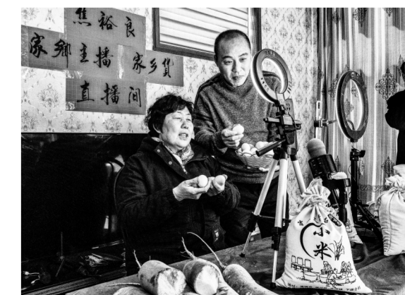
2022年2月22日 峨庄下端士村

曾担任国展、中国国际新闻摄影比赛(华赛)评委;2020年担任第十三届中国摄影金像奖评委。