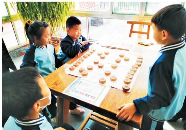
文惠百姓,童趣斗智