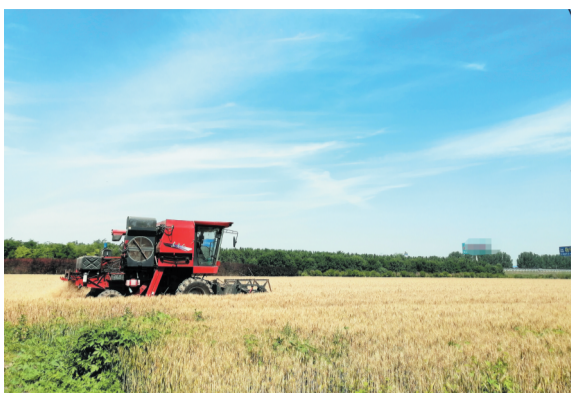
支部领办合作社迎丰收