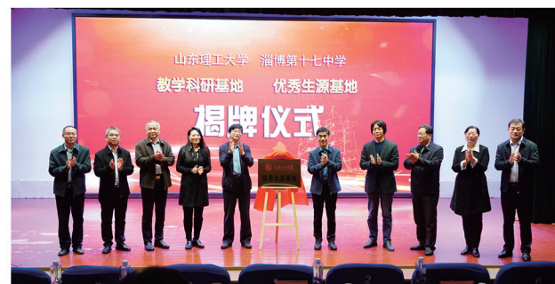
淄博十七中与山东理工大学在阶梯教室举行了“优秀生源基地”“教学科研实践基地”“社会实践基地”签约授牌仪式。