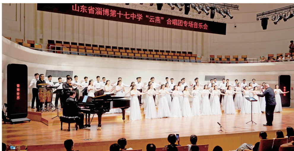
6月28日，淄博十七中“云燕”合唱团专场音乐会举行。

2021年10月，淄博市普通高中“艺术学科基地校”；2022年8月，淄博市首批市级特色高中，淄博十七中作为淄博市唯一一所艺术特色类学校入选，这可以说是实至名归。近年来，淄博十七中秉承“面向全体 激发潜能 特色鲜明 优质发展”的办学宗旨，坚持“适合教育”办学理念，落实立德树人根本任务，在文理并重、全面发展的基础上，致力于拓展艺术教育办学之路，艺术教育成果丰硕，并赢得广泛赞誉。下面就跟随几个镜头来了解淄博十七中的艺术特色发展。