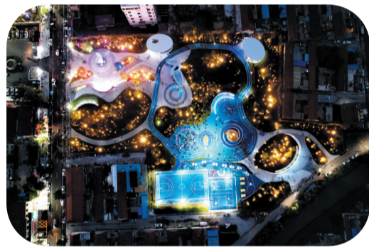
唐山镇文体公园夜景