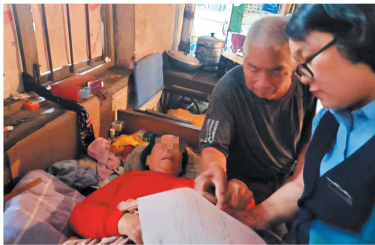
工作人员上门为老人办理授权手续。