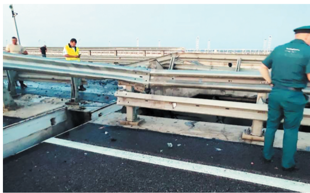
遭袭后的克里米亚大桥

据俄新社、路透社等媒体报道，当地时间7月17日凌晨3时许，连接克里米亚半岛和俄罗斯本土的克里米亚大桥再次发生爆炸，造成两人死亡，一人受伤。俄罗斯外交部称英美直接参与乌方决策炸桥，乌方并未承认炸桥，但称克里米亚大桥是多余设施。