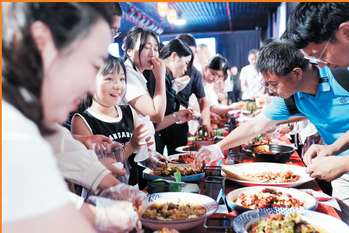
市民现场品鉴小龙虾