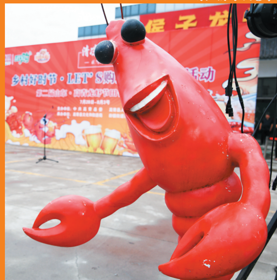
高青龙虾节田镇街道办活动现场