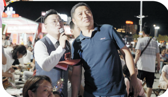
主持人现场互动,观众热情参与。