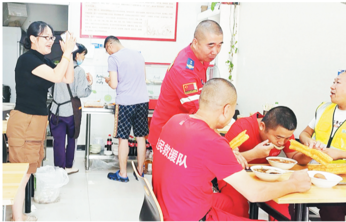
面对队员感谢,女子拱手致意。

“让我老公给你们付餐费……”见救援队员有人拿着手机要付款,女子边说边摆手,快速起身走到救援队员身旁。