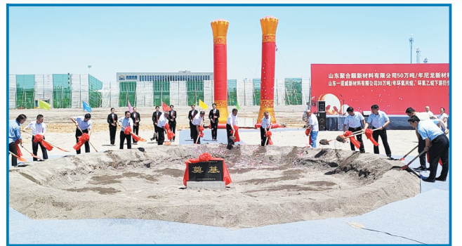
6月30日,重点项目集中开工奠基仪式在临淄区金山镇举行。

强镇强省,东部发达地区表现突出。江苏省、浙江省、广东省三省表现突出,分别占137席、86席和81席。500强镇前50名中,广东省占据20席,江苏省占据16席,浙江省占据4席,福建省、安徽省和陕西省各占据2席,河北省、湖北省、内蒙古自治区和贵州省各占据1席。