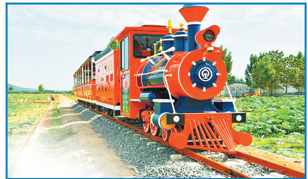
临淄区凤凰镇盛水荷源田园综合体