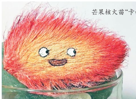
芒果核火苗“卡西法”。