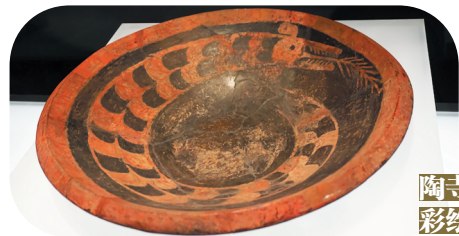
陶寺遗址彩绘龙纹陶盘

妇好墓的象牙杯也是举世闻名的器物。妇好墓中出土的陪葬物多达千余件，其中的3件象牙杯尤其引人注目，而仅有一件是嵌绿松石象牙杯。中国考古博物馆展出的象牙杯，通体雕刻繁缛精细的花纹，有兽面纹、夔纹等，画龙点睛的就是镶嵌在象牙中的绿松石。