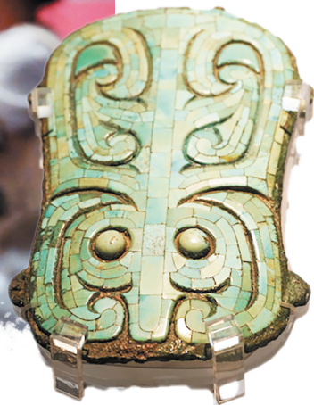
二里头遗址出土的绿松石铜牌饰

这件牺尊的独特之处，在于器身上附着的四只动物。其背部的盖钮上，站立着一只凤鸟。项背上附着一只卷尾虎，作行走状。胸前和臀部则各有一只回首卷尾龙。盖内底部和器体内各有两行六字铭文：“邓仲作宝尊彝”。因此，这件牺尊也被称为邓仲牺尊。