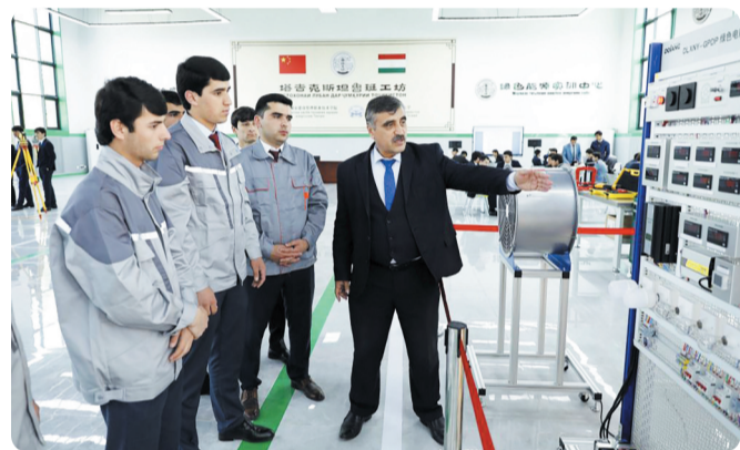
4月12日，在塔吉克斯坦首都杜尚别的鲁班工坊内，塔方教授向学生讲解绿色电能展示平台的功能与使用方法。