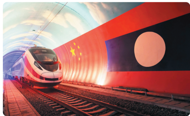
这是“澜沧号”动车组通过中老友谊隧道内的两国边界(2021年10月15日摄)。