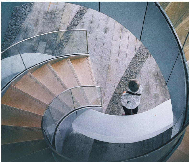
电影《外婆的新世界》海报