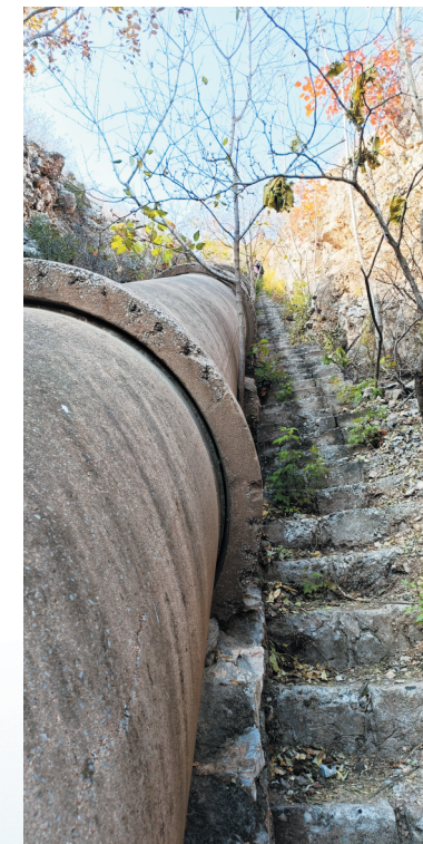
淄河西调、引淄入坪工程段水渠