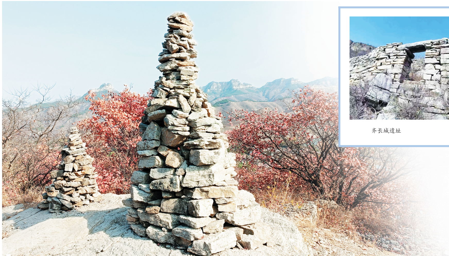
游人在山顶垒的平安石