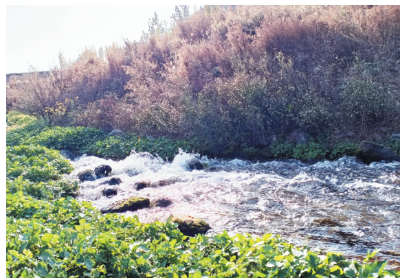
天然无污染的泉水是城子村的一大优质资源。