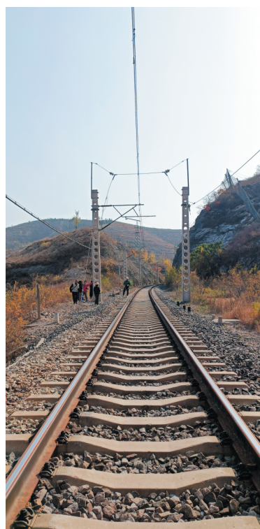
辛泰铁路从村西穿境而过。