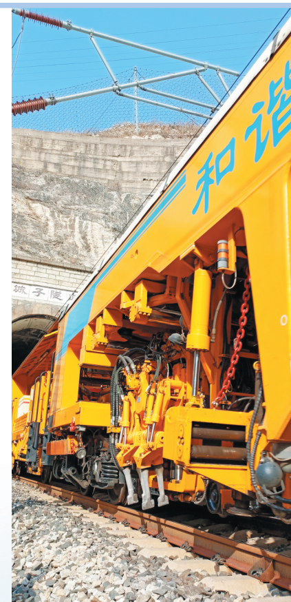
“和谐号”机车从城子隧道呼啸而过。