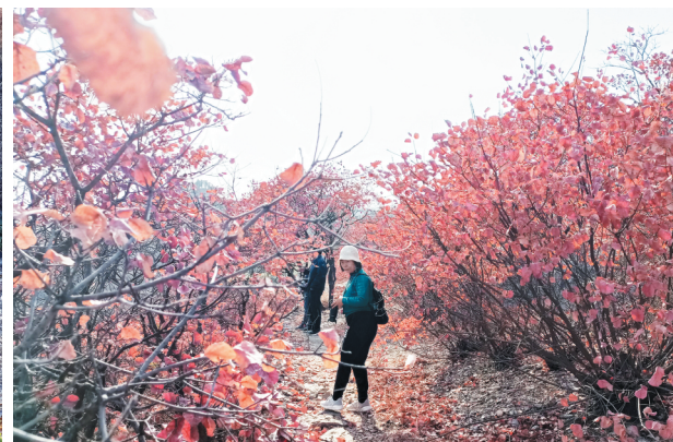
红叶正浓，游人不断。