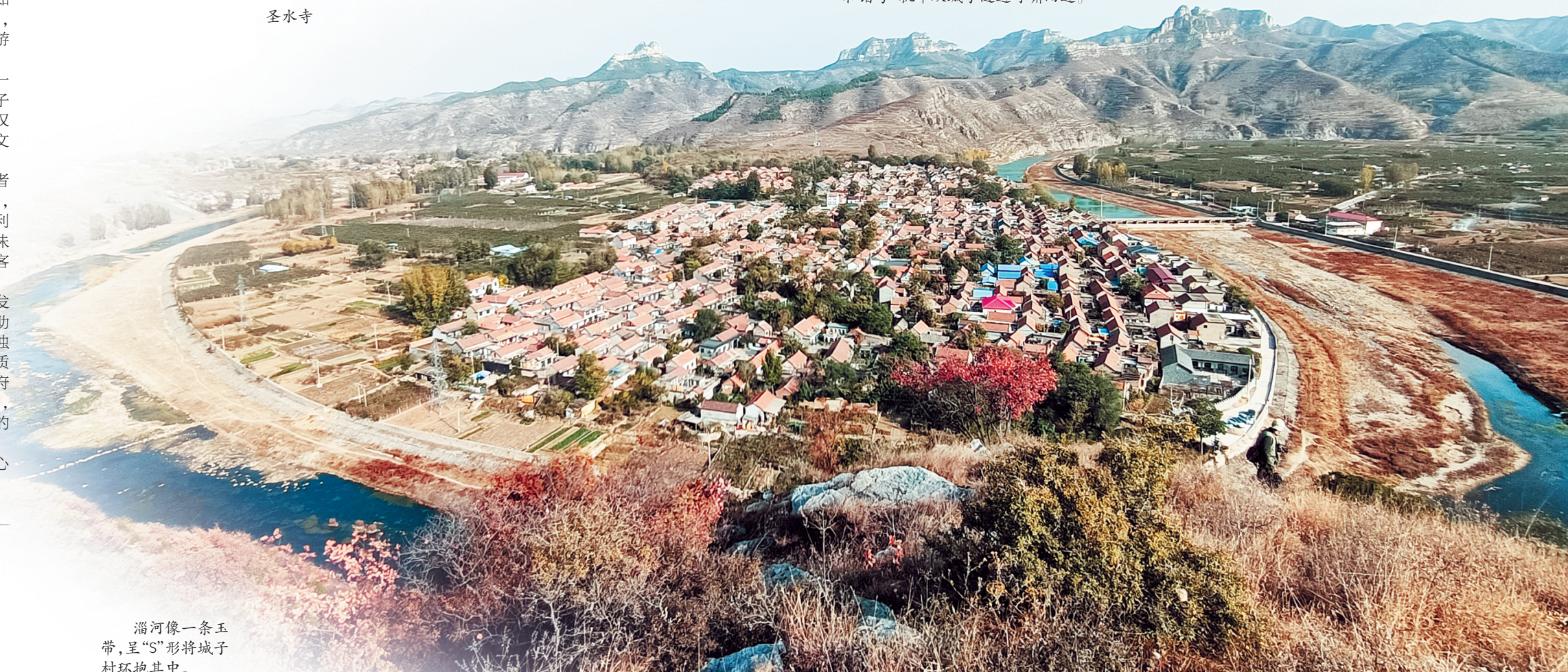
淄河像一条玉带，呈“S”形将城子村环抱其中。