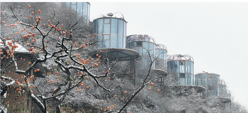
齐山景区,雪后挂在枝头的柿子,犹如一串串红灯笼。