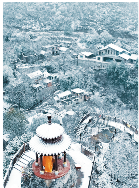
初雪过后,大地披上洁白绒装,美成了童话世界。