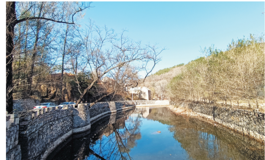
青杨河支流穿村而过。