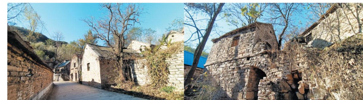
村内水泥路可通行汽车。