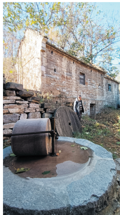
石碾旁边闲置的磨盘是从淄川崇山运来的。