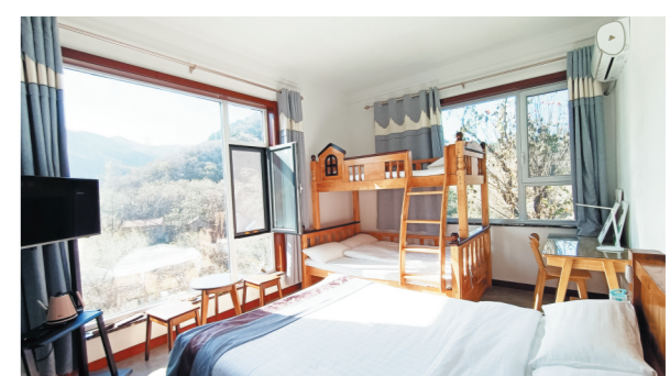
民宿里带落地窗的宽大观景房。