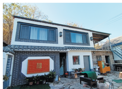
刚装修完工的“沈家别苑”。