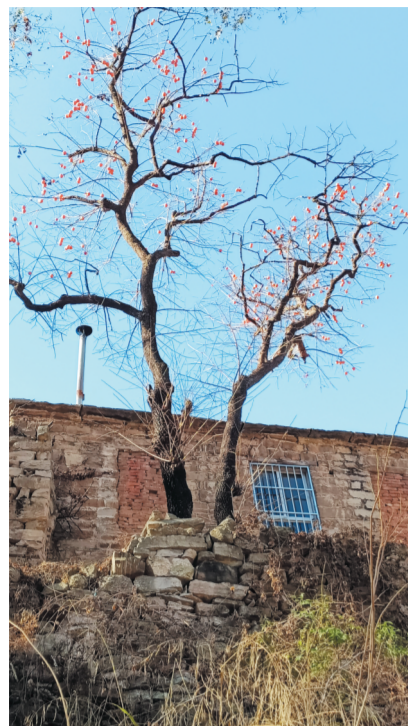
柿子悬挂枝头无人采摘。