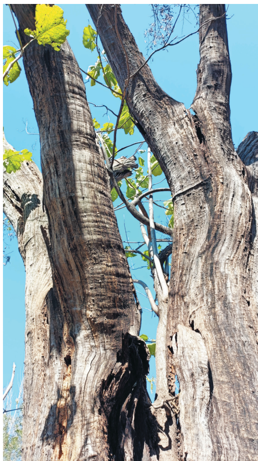
古枫的裂缝中长出一株梧桐。