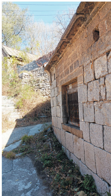
当年交通要道上的官屋