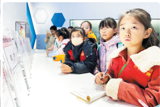
小记者们一边听讲解一边认真记录。