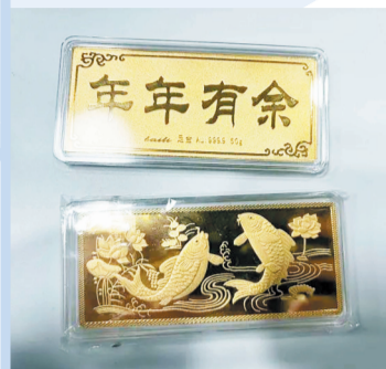
市场上销售的金条。