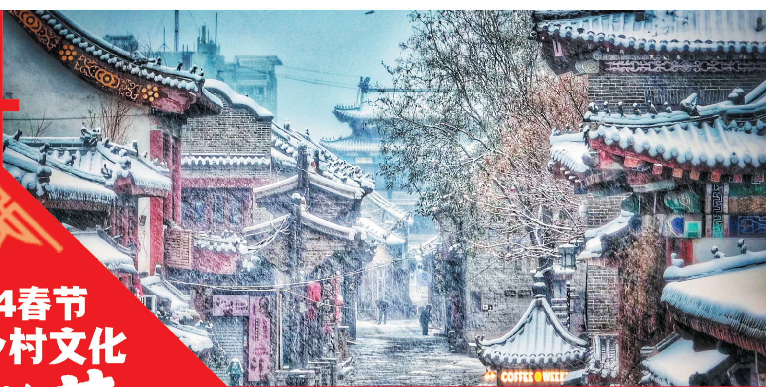
雪后的古商城别有韵味。