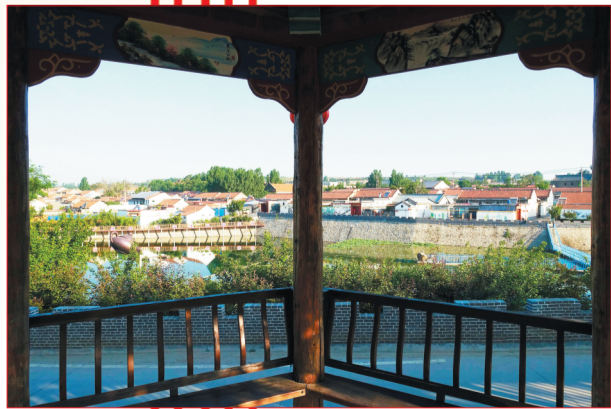
韩家窝风景如画。 资料照片

村道平坦整洁，墙绘多姿多彩，民宿古色古香……走进淄博市周村区南郊镇韩家窝村，墨水河两岸，一栋栋仿佛从土地里“生长”出来的、颇具鲁中风情的民宿，与自然融为一体，宛如一颗颗明珠散落在宁谧的小村庄中，步入其中，一步一景，让人流连忘返。韩家窝村地处周村城区