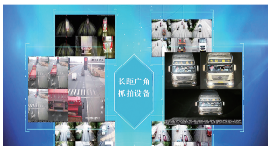
长距广角抓拍设备

开始，集中开展大货车交通违法专项整治行动，重拳出击整治大货车交通违法行为。截至目前，全市非现场查处大货车交通违法行为36870起，其中，闯红灯2128起，遮挡、污损、未悬挂、未按规定悬挂号牌857起，超速3107起，闯禁区12933起，全力维护了道路交通安全形势持续平稳，预防了道路交通事故。