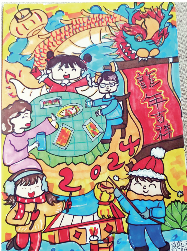
张店二中学生作品。