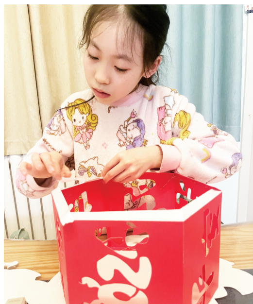
张店区实验小学五年级的学生正在制作龙年手工艺品。