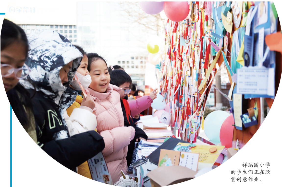
祥瑞园小学的学生们正在欣赏创意作业。