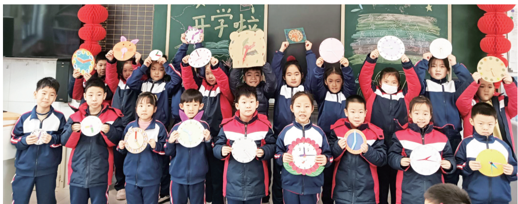
绿杉园小学一年级八班同学展示寒假作业手工作品。