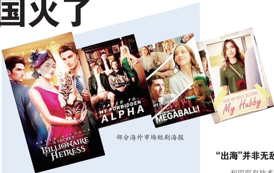
部分海外市场短剧海报

但一个必须面对的现实是，人工智能技术虽然可以轻松“换脸”，修改剧情却是大动作。毕竟，欧美观众更能够接受带有狼人、吸血鬼元素的霸道总裁角色，而对非洲观众来说，英俊潇洒、雷厉风行的农场主就足够配得上霸道总裁的人设。虽然人工智能“换脸”技术可以将国产微短剧中的东方面孔改成金发碧眼，但如何在诸多涉及文化背景、习俗理念方面实现“本土化”修改，这个行业还在摸索。