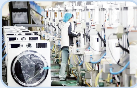
工人对下线的洗衣机进行检测。

国家统计局数据显示,2023年我国社会消费品零售总额增长 7.2% ,最终消费支出对经济增长的贡献率达到 82.5% 。