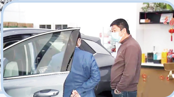
市民向销售人员了解纯电动汽车的补贴政策。