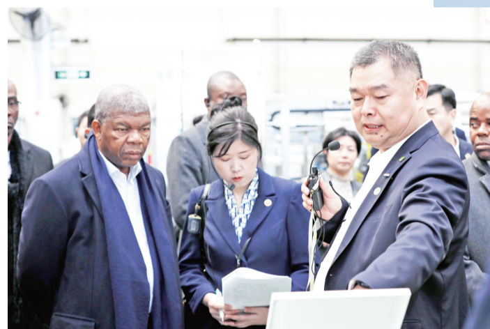
洛伦索参观新华医疗制药装备生产车间。