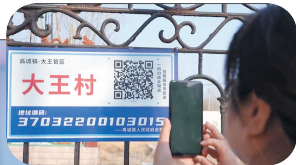
村民扫描二维码就可以上传需要反映的问题。 视频截图