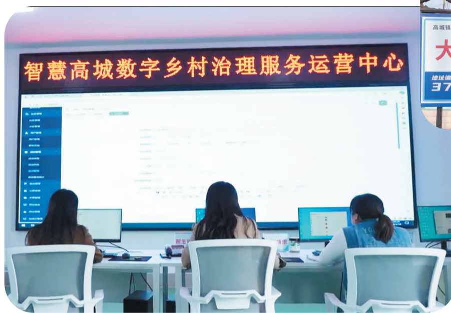
智慧高城数字乡村治理服务运营中心 视频截图

高城镇基于自身需求，以系统思维谋划，建设了淄博市首家镇级数字乡村治理服务运营中心——智慧高城数字乡村治理服务运营中心（下称“智慧高城”），数字装备“全覆盖”，一网终端“全办结”，是这里的基本概述。这个智慧“大脑”，让“数字化”这个概念，在村民生活中鲜活而具体起来。