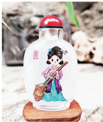
颜笑笑系列文创产品

淄博3月26日讯 围绕三驾马车,布局6个产业生态圈,做强12条产业链,打好4场攻坚战,开展7个领域的文旅服务管理大提升行动……今天,博山区举行旅游发展大会,再次为博山文旅聚共识、明方向、定举措、开新局。