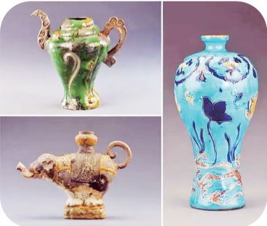
南海西北陆坡一号沉船遗址出土的瓷器。左上为螺形壶,左下为三彩象形持壶,右为珐华彩莲纹梅瓶。

目前,这些文物正静静地“躺”在南海博物馆里,由工作人员进行专业保护。博物馆正在筹备展览,争取今年让观众能看到这批珍贵文物。