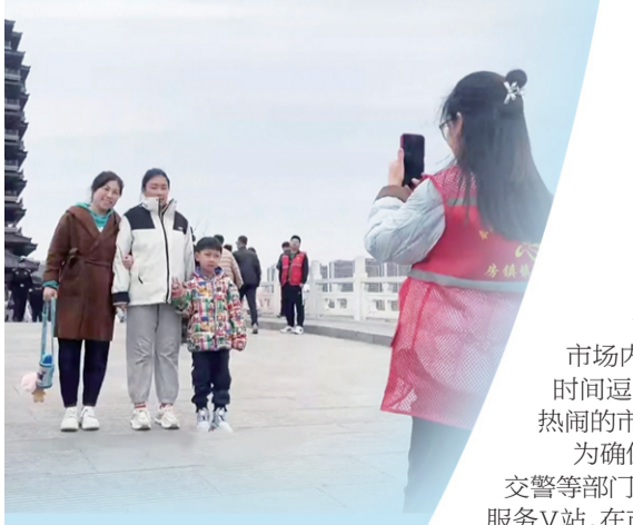
张店区房镇镇志愿者在齐盛湖帮助游客拍照。