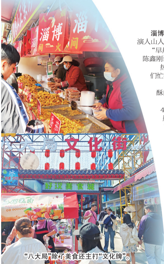
“八大局”除了美食还主打“文化牌”。