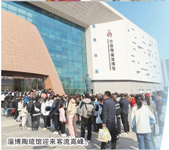
淄博陶琉馆迎来客流高峰。