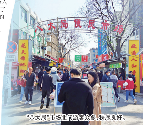
“八大局”市场北门游客众多,秩序良好。