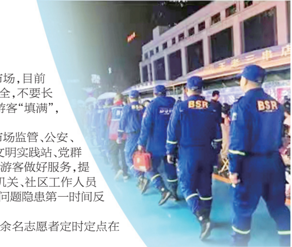
在浅海美食城,蓝天救援队员帮助维持秩序。