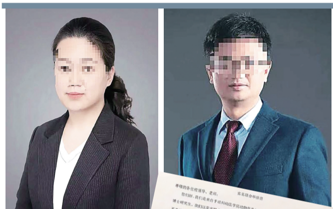
被北邮15名学生联名举报的 教师郑某。

剑拔弩张的个案之外，也不乏融洽、和谐的师生关系。4月11日，华中农业大学曾参与举报的学生告诉记者，她的新导师“特别好、很细心”。