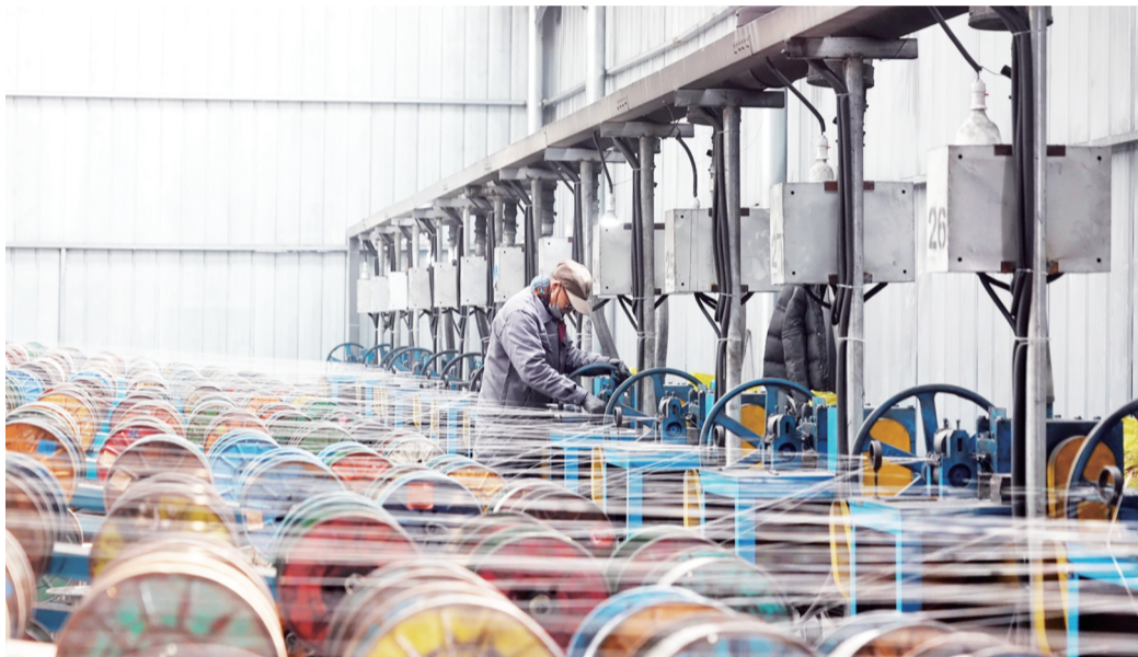
淄翼金属材料公司标准化工业生产线上