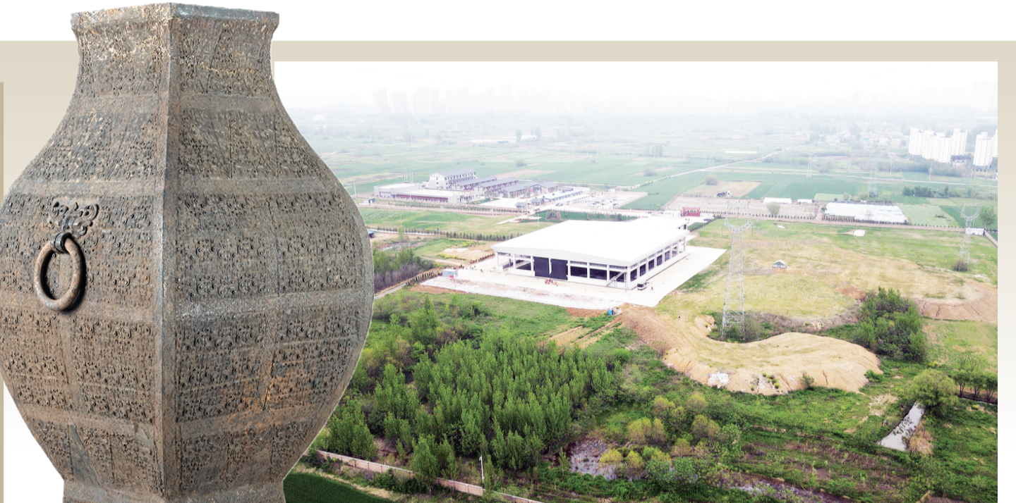
位于安徽省淮南市的武王墩墓考古发掘现场(2024年4月15日摄,无人机照片)。