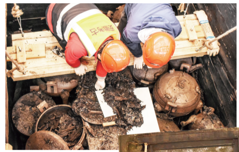
考古工作者在安徽淮南武王墩主墓内提取脆弱的文物(2024年4月6日摄)。