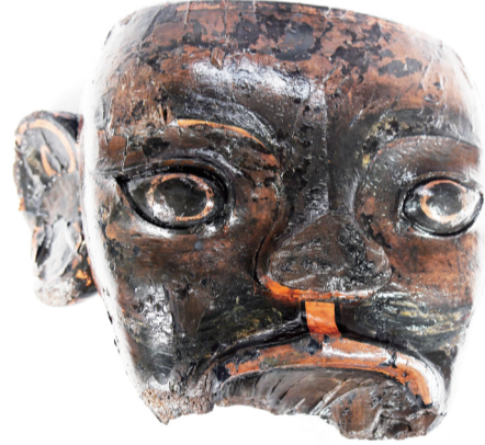
武王墩墓出土的木俑首(2024年4月2日摄)。