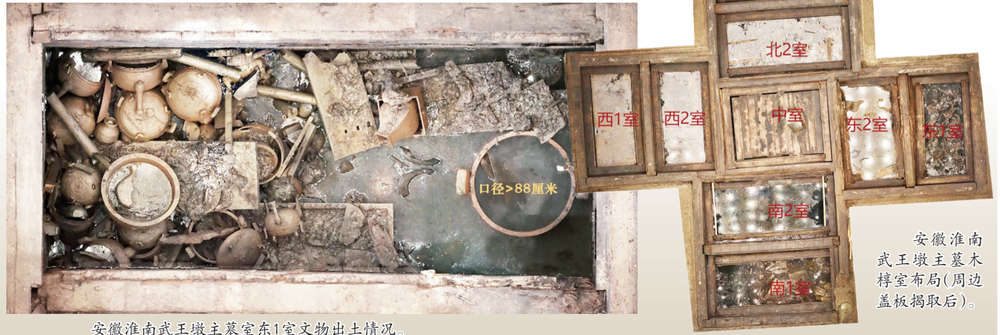
安徽淮南武王墩主墓室东1室文物出土情况。