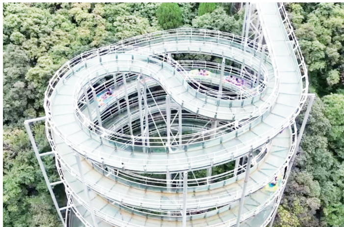
玻璃水滑道 视频截图

和尚房村原来是个落后的原始村落,在村企联合党委的带动下,这里已成为红叶柿岩景区知名的网红打卡地——原舍清芷主题民宿。自2012年启动护改开发后,和尚房村村民们通过资源入股的方式参与公司发展,不仅鼓了腰包,也挺直了腰杆。