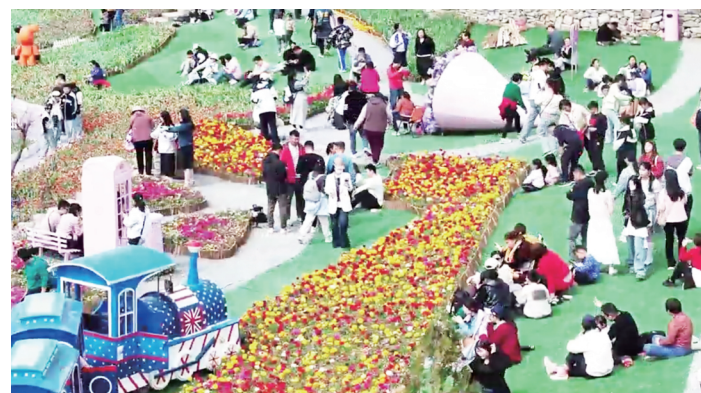
假期游客纷至沓来。视频截图

过去,和尚房村有60岁以上老人近百人,在护改开发前,村里几乎所有的壮劳力都在外打工,人口流失非常严重。护改开发后,华旅公司不仅给村里带来了好项目,每年还给村集体20万