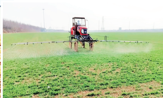
李王村流转的土地使用大型农机进行管理,这是对农作物进行灌溉。