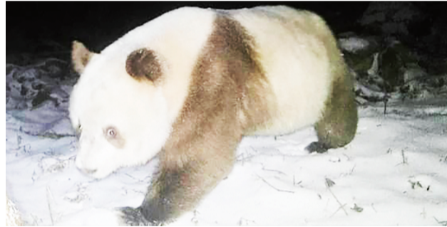
红外相机拍摄到棕色大熊猫。

棕色大熊猫是秦岭大熊猫家族中的特殊成员。据悉,包括此次发现在内,世界上有科学记载的棕色大熊猫发现地点在陕西省佛坪县、洋县、太白县和周至县境内,均属于陕西秦岭山脉地区。