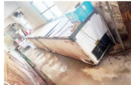
存放动物幼崽尸体的冰柜