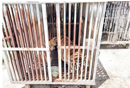
在狭小笼子里休息的东北虎