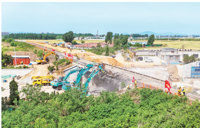
淄博至博山铁路改造工程开启封锁施工。

淄博5月16日讯 今天,伴随着施工负责人一声令下,由中铁十局承建的淄博至博山铁路改造工程正式开启封锁施工。