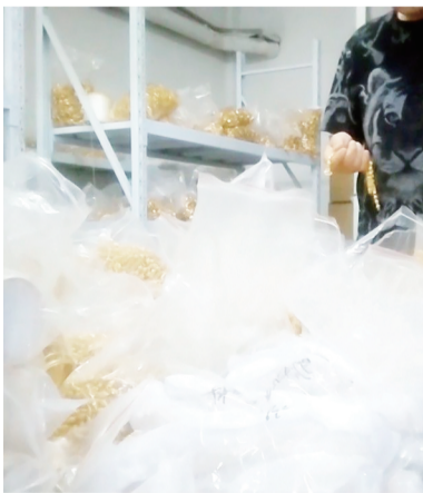
这些仿金饰品的出货价只要几元。

商家首先销售足金，攒足人气，烘托真金销售直播间的火爆氛围。之后借着卖黄金产品烘托出的氛围开始推销合金产品。记者在一家卖手镯的直播间里通过粉丝群里的链接，花299元购买了一只足金手镯。当主播下播之后，粉丝群即刻解散，订单信息无迹可寻，只剩下支付记录。将产品送检后，这款手镯主体材质为铜。可想而知，当普通消费者碰到这样的情况时，想维权都找不到证据。