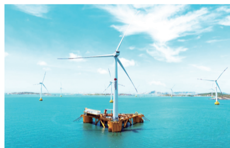
全球首座风渔融合浮式平台

碳纤维地铁列车最高速度达140公里每小时，与传统地铁行驶速度90公里每小时相比，速度大大提升。